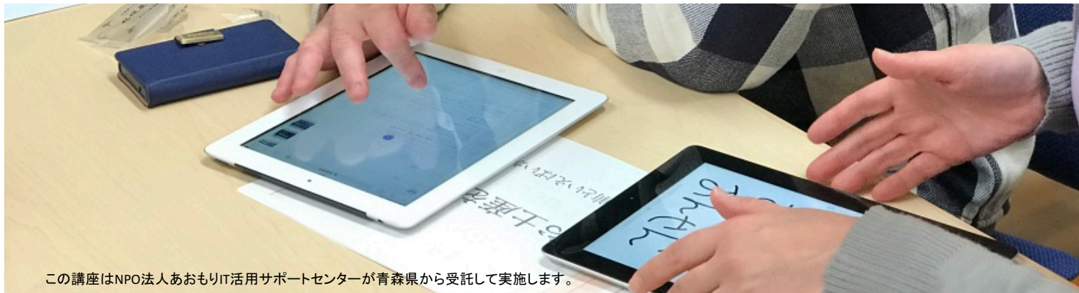
この講座はNPO法人あおもりIT活用サポートセンターが青森県から受託して実施します。