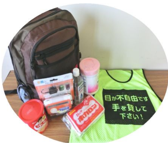
6 3 視覚障害者用防災グッズ 基本セット