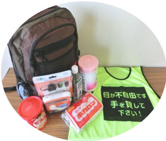
6 3 視覚障害者用防災グッズ 基本セット