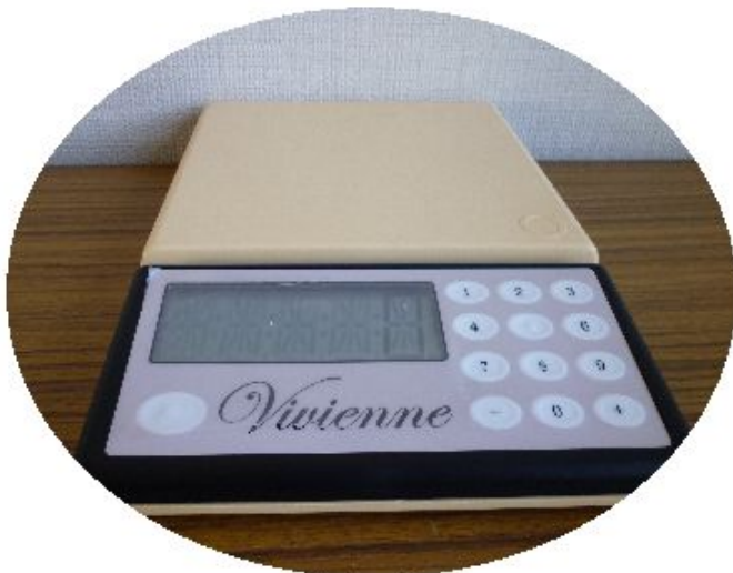
33 音声キッチン はかりビビアン