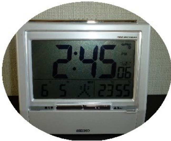
9 音声置時計 トークライナー