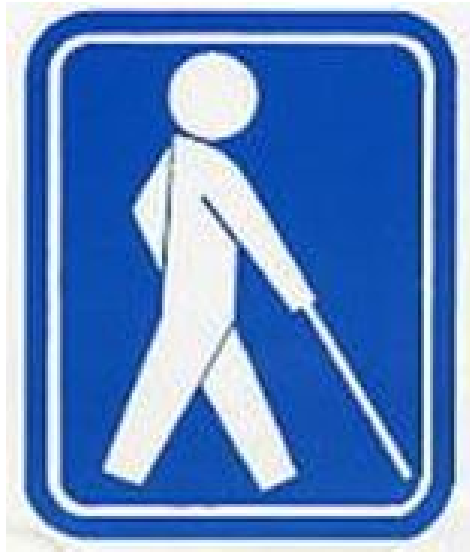
盲人のための国際シンボルマーク