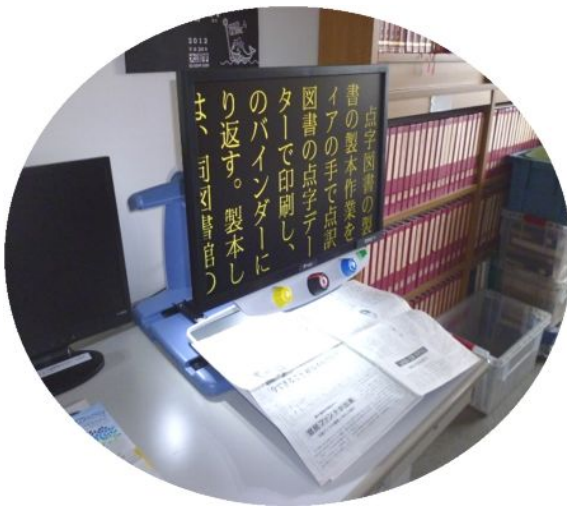
8 8 拡大読書器 据置型 トパーズ