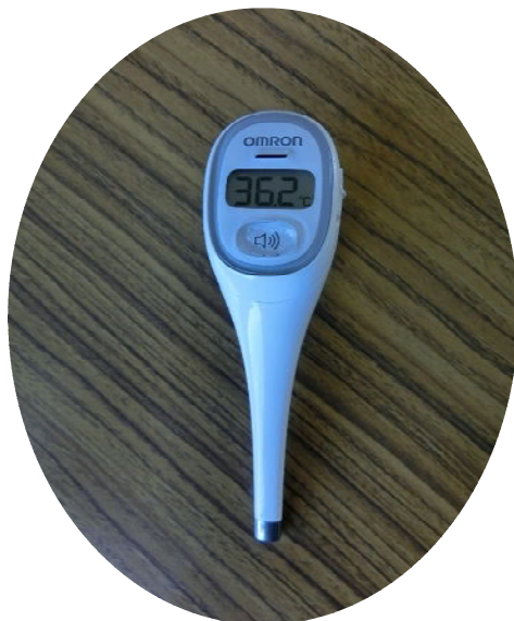
19 音声付体温計 けんおんくん