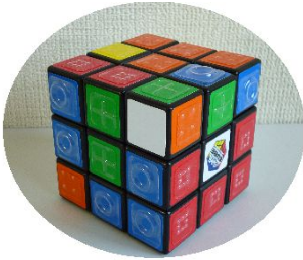
45 ルービックキューブ (触覚記号付)