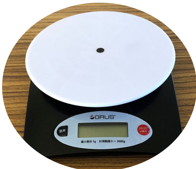
3 7 GRUS ボイス クッキングスケール