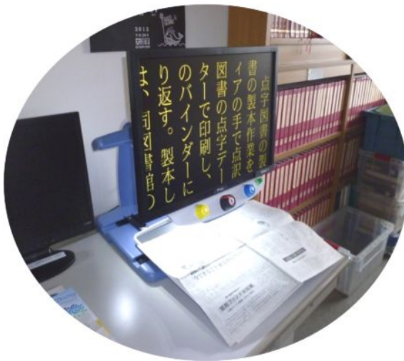
95 拡大読書器 据置型 トパーズ